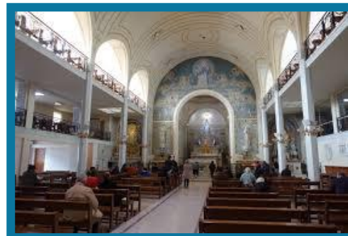
Tour Eiffel, Ave des Champs-Élysées et la Chapelle de la Médaille Miraculeuse