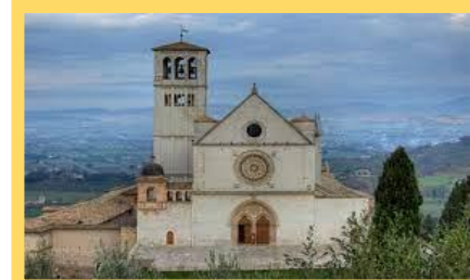
Tombeau du bienheureux Carlo Acutis et la Basilique Saint François d'Assise.